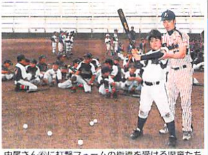
中尾さん心打撃フォームの指導を受ける児童たち

プロの技を間近で 野球教室、児童個人学ぶ 五所川原 少年野球教室を開いた。児童たちはプロ野 6月28日、五所川原市「つがる克雪ドーム」で、大四郎弘理事長は、球の元ヤクルトスワローズ選手から打撃