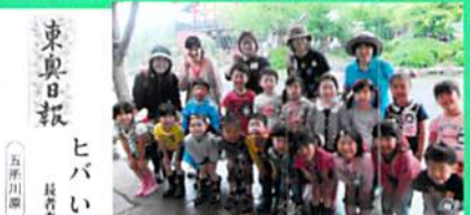
東奥日報 2014-6-22 ヒバいつか森に 長青会公開市民が植樹 五所川原 山形県五所川原市金山の市民の森で、五所川原市長をはじめ多くの組合員、高校生など約100名が集い植樹会を開催しました。