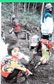
ヒバの苗木を丁寧に植える参加者たち